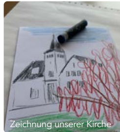
Zeichnung unserer Kirche