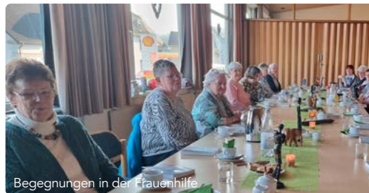
Begegnungen in der Frauenhilfe