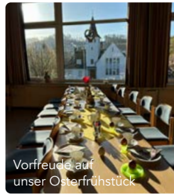
Vorfreude auf unser Osterfrühstück