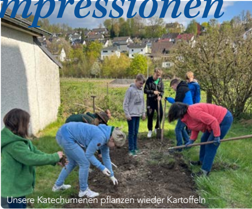
Unsere Katechumenen pflanzen wieder Kartoffeln