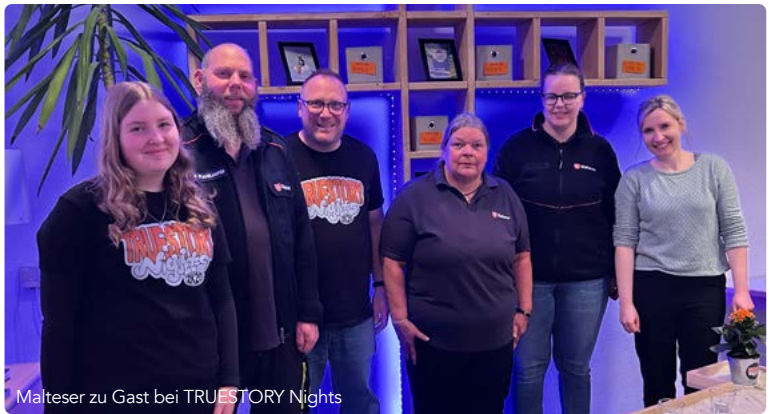
Malteser zu Gast bei TRUESTORY Nights