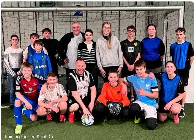
Training für den Konfi-Cup