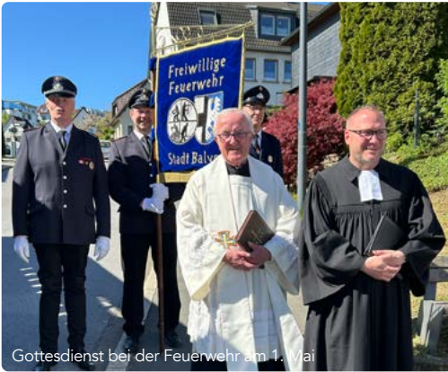
Gottesdienst bei der Feuerwehr am 1. Mai