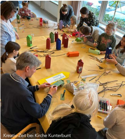
Kreativ-Zeit bei Kirche Kunterbunt