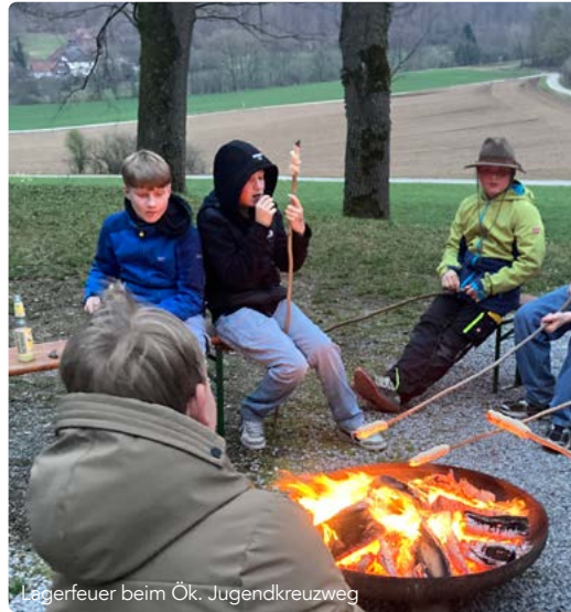
Lagerfeuer beim Ök. Jugendkreuzweg