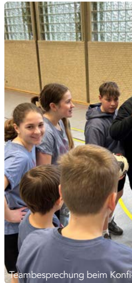
Teambesprechung beim Konfir