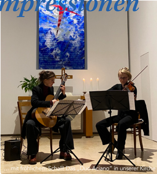
... mit fröhlichem Schall! Das „Duo Aciano“ in unserer Kirche