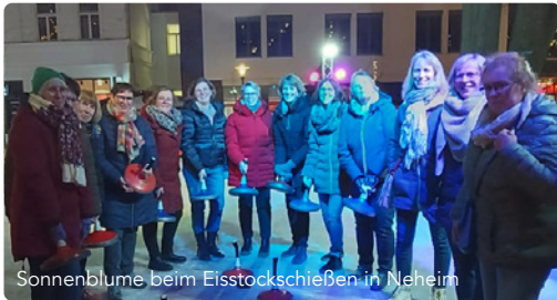
Sonnenblume beim Eisstockschießen in Neheim