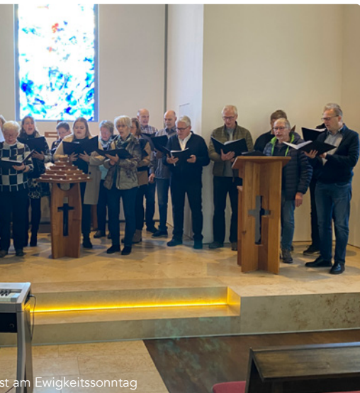
st am Ewigkeitssonntag