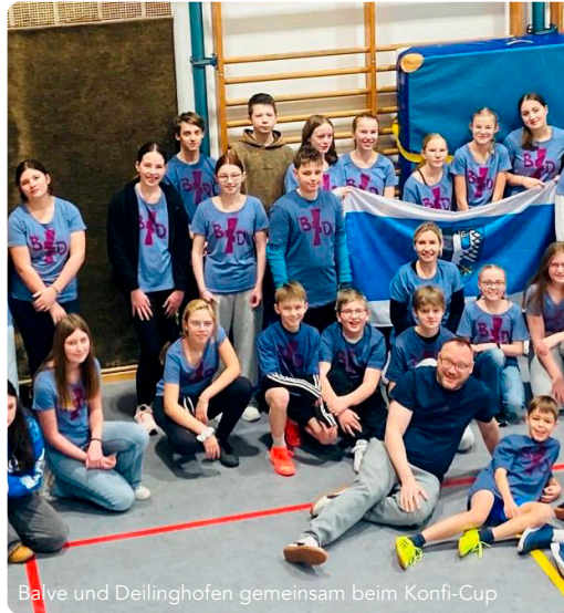
Balve und Deilinghofen gemeinsam beim Konfi-Cup