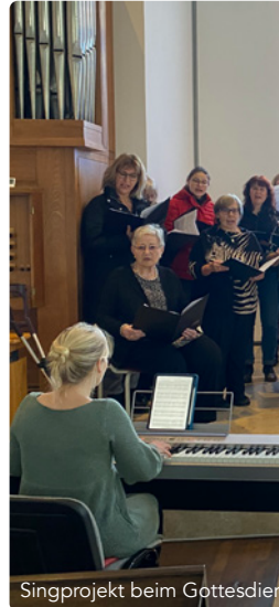
Singprojekt beim Gottesdienst