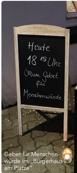
Gebet für Menschenwürde im „Bürgerhaus am Platz“