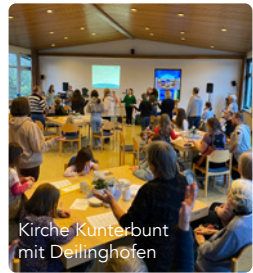
Kirche kunterbunt mit Deilinghofen