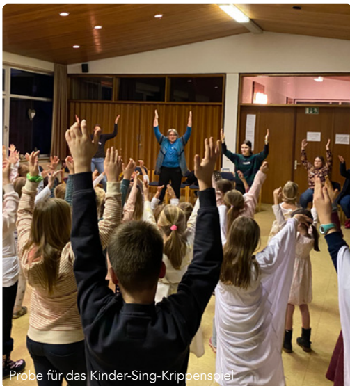
Probe für das Kinder-Sing-Krippenspiel