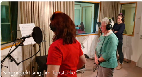
Singprojekt singt im Tonstudio