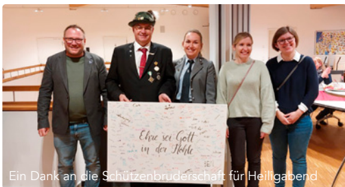
Ein Dank an die Schützenbruderschaft für Helligabend