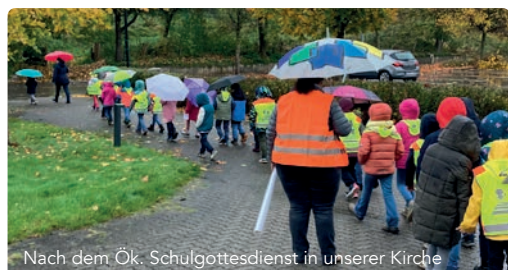
Nach dem Ök. Schulgottesdienst in unserer Kirche