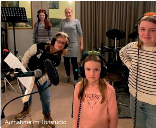
Aufnahme im Tonstudio