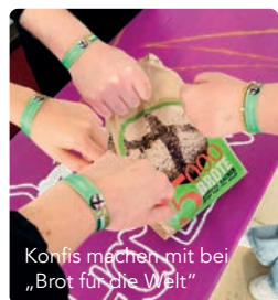
Konfis machen mit bei „Brot für die Welt“