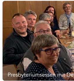
Presbyteriumssessen mit Deil