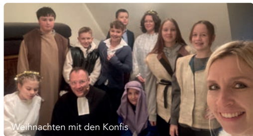
Weihnachten mit den Konfis