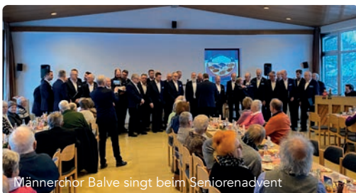
Männerchor Balve singt beim Seniorenadvent