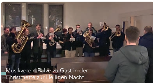
Musikverein Balve zu Gast in der Christmette zur Heiligen Nacht