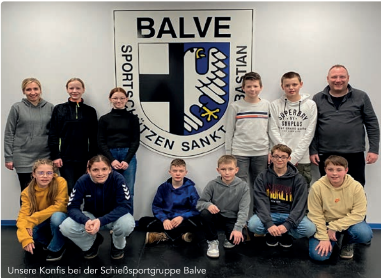
Unsere Konfis bei der Schießsportgruppe Balve